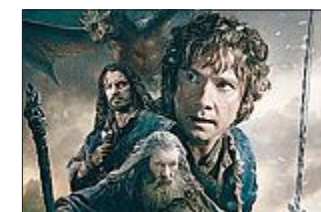
Esce il 17 dicembre "Lo Hobbit: la battaglia delle 5 armate"