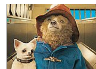
L'orsetto inglese "Paddington" arriva in Italia il giorno di Natale

amici aiutano Hiro a ritrovare la voglia di vivere e poi, anche ad affrontare un misterioso personaggio mascherato che minaccia San Fransokyo. «In questo paese calpestato, chi non vorrebbe con sé un personaggio rassicurante e coccoloso come Baymax», dice Insinna, alla sua prima esperienza di doppiaggio. «In questo momento servirebbe un Baymax in Campidoglio. E ne servirebbero un po' ovunque. Avremmo un paese migliore», aggiunge l'attore, che in questi giorni arriva nelle librerie con il romanzo "La macchina della felicità".