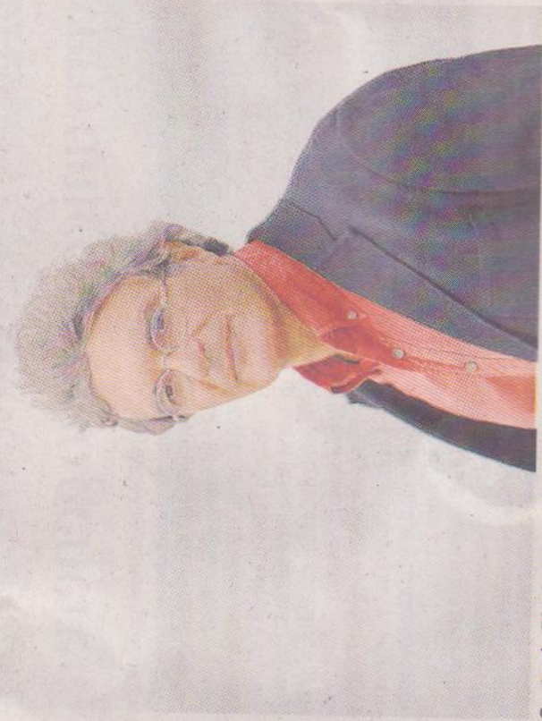
Gente da Riccione Teatro (in cima); Mario Martone eroe del TTV