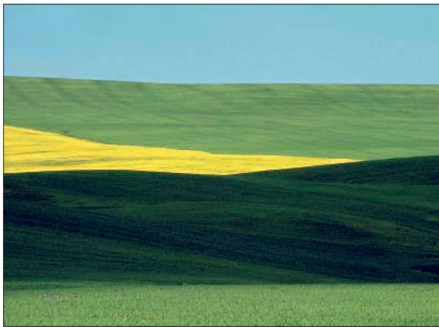
Uno dei maestri della fotografia paesaggistica italiana e internazionale: Franco Fontana

Fontana, che ha appena compiuto gli 80 anni, afferma che «non esiste quello che vedete, esiste quello che fotografate». Cominciò a dedicarsi alla fotografia amatoriale nei primi anni Sessanta, allestendo la prima personale a Modena nel 1968; all'inizio degli anni Settanta era già un affermato autore del colore. La sua è stata una scelta