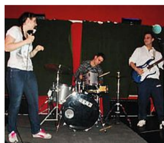
Una jam session dello scorso anno

Per poter partecipare non occorre far altro che recarsi al Patchanka armati del proprio strumento ogni ultimo giovedì del mese, in modo da venir subito inseriti nell'elenco di chi