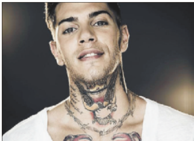
Il rapper Emis Killa stasera a Bellaria con la data zero del suo tour

“Lo dico sempre anche io: fare dieci milioni di visualizzazioni su youtube non si