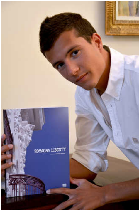
ROMAGNA LIBERTY. La mostra dedicata all'architettura Liberty in Romagna