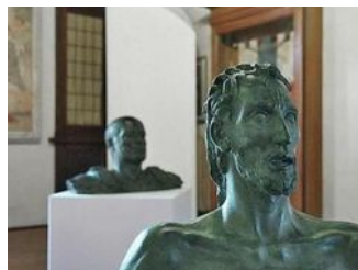
Al Castello di Marostica sono esposte anche alcune delle sculture