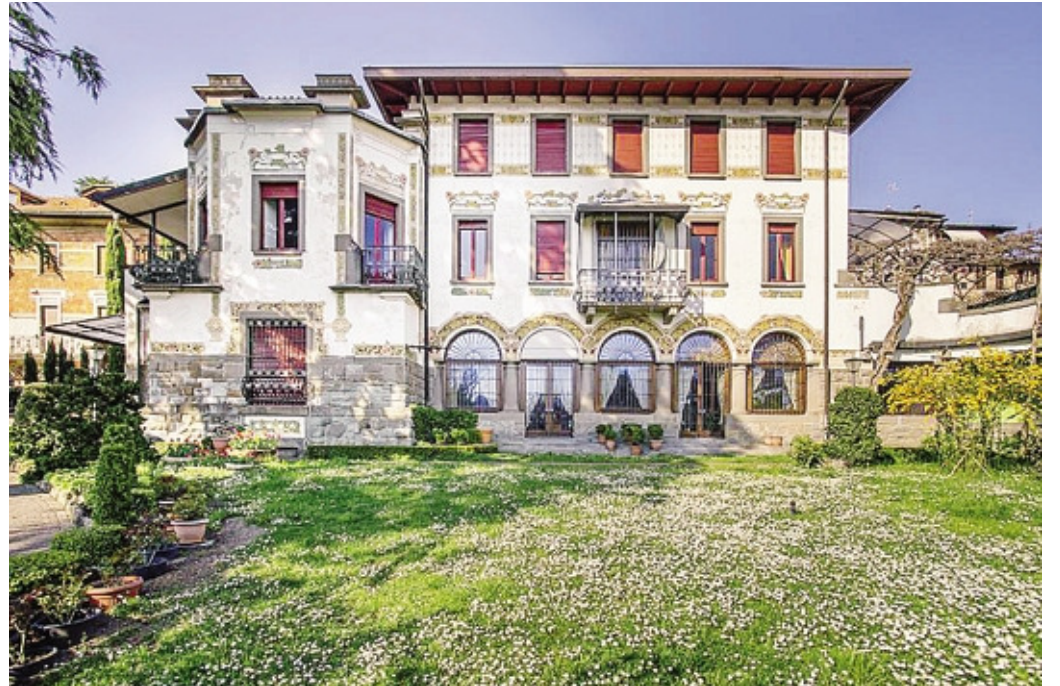
Uno dei gioielli di Sarnico, villa Passeri, in piazza XX Settembre

Nel frattempo, a salutare con soddisfazione il successo di testimonial del Liberty nazionale, è il primo cittadino Giorgio Bertazzoli: «Certamente sulla decisione di Italia Liberty ha influito l'anniversario dei cento anni dalla scomparsa ed i 150 dalla nascita di Giuseppe Sommaruga, il quale arrivò a Sarnico grazie alla lungimiranza e alle notevoli possibilità economiche della famiglia Faccanoni. Ma va dato atto che da sempre chi ha amministrato la cittadina, anche in passato, ha dimostrato sensibilità. Peraltro, nel corso degli ultimi anni abbiamo intensificato le iniziative, in colla-