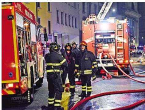
L'intervento dei vigili del fuoco

Danni, paura e decine di persone in strada ieri sera in via Borgo Palazzo, dove ha preso fuoco il tetto del condominio al civico 78, a poca distanza da piazza Sant'Anna. L'allarme è scattato verso le 20,30, quando i residenti del palazzo e degli edifici vicini hanno avvertito un forte odore di bruciato e, affacciandosi, hanno visto le fiamme e il fumo. Immediato l'allarme ai vigili del fuoco, che sono arrivati con diversi mezzi insieme alle forze di polizia. Le fiamme, se-