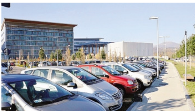
Confermata l'intesa per tagliare i costi della sosta al «Papa Giovanni»

Sono partiti i lavori per realizzare i 508 posti auto destinati al personale dell'ospedale «Papa Giovanni XXIII»: saranno pronti presumibilmente per dicembre. Una «valvola di sfogo» attesa, perché così si libereranno i posti attualmente occupati dai dipendenti del «Papa Giovanni». Oggi, su un totale di 2.344 posti, l'Asst ne ha assegnati ai propri dipendenti 1.200, dietro pagamento di una quota annua alla società di gestione Bhp, Bergamo hospital parking. Nel dettaglio