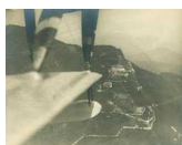
Grand Hotel Campo dei Fiori