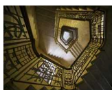
Varese, Grand Hotel Campo dei Fiori, Foto di Sergio Ramari