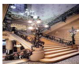
Milano, Palazzo Castiglioni, Scalone