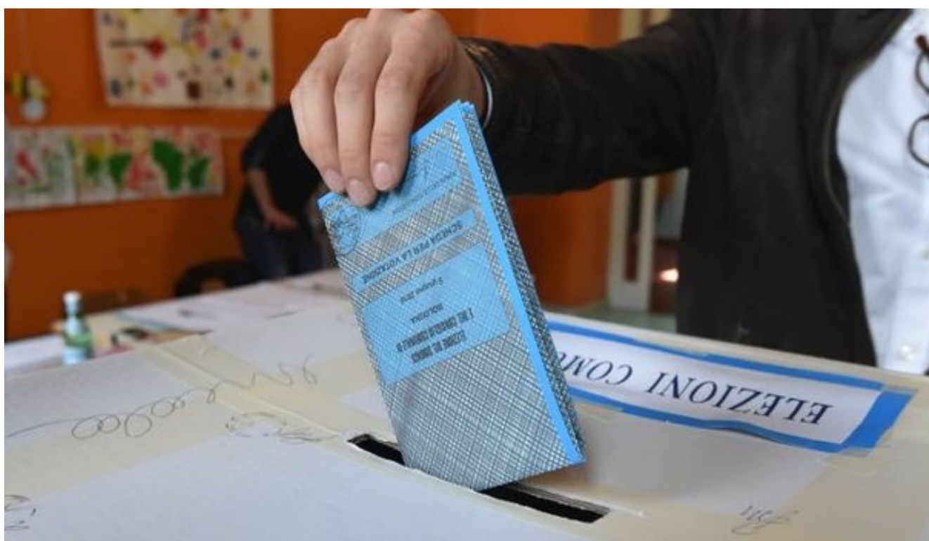
Elezioni amministrative 2017

di ANDREA OLIVA Ultimo aggiornamento: 25 maggio 2017