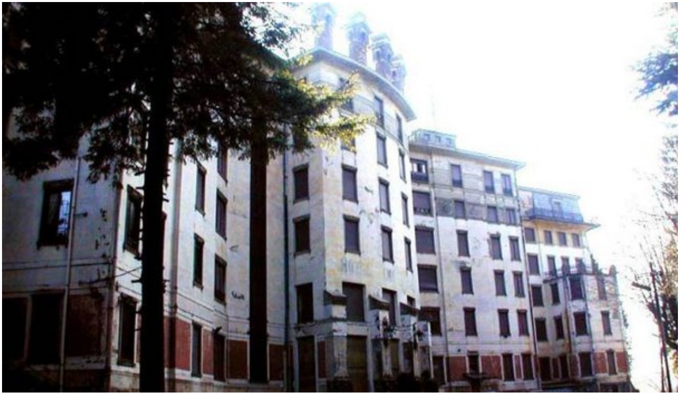
Il Grand Hotel Campo dei Fiori

di ANDREA GIANNIUltimo aggiornamento: 24 maggio 2017