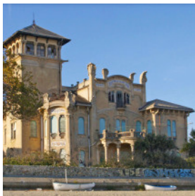
Villa Zanelli di Savona

Nell'anno dedicato all'Art Nouveau è stato indetto un concorso fotografico nazionale per promuovere il patrimonio artistico culturale Liberty. Uno stile che agli inizi del Novecento trasmetteva ottimismo ed era sinonimo di eleganza e borghesia.