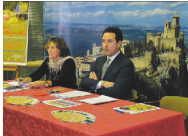
Il segretario al Turismo, Teodoro Lonfernini alla presentazione

Lungo il percorso sarà facile farsi tentare dai numerosi ristoranti e assaporare le pietanze preparate dagli chef. Le tipiche e graziose baite in legno proporranno tante idee regalo e gustose ghiottonerie da assaggiare. Un incantevole e allegro Villaggio delle Meraviglie abitato da fiabeschi personaggi attenderà