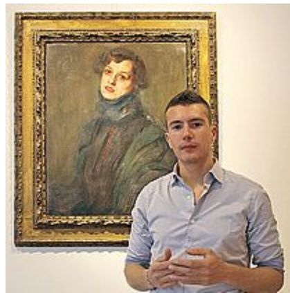
Non tornerà a Riccione il quadro di Klimt per motivi di sicurezza