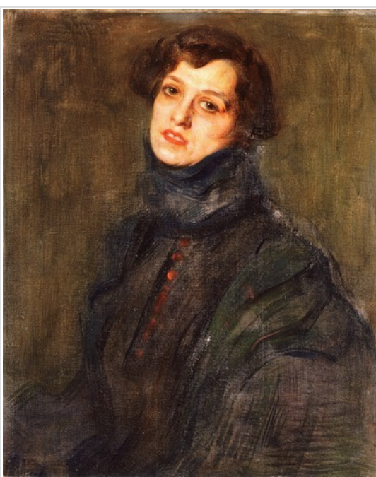
una delle opere esposte: Gustav Klimt, Ritratto di Nobildonna

Maggiori informazioni: www.romagnaliberty.it