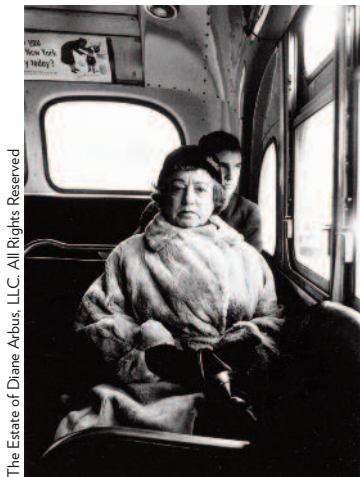
The Estate of Diane Arbus, LLC. All Rights Reserved