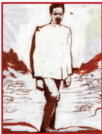
Venise, 2015 / Photo: Archive Fondazione Musei Civici di Venezia

Quando: 1-10 agosto Info: italiainliberty.it; musa.comunecervia.it ▲