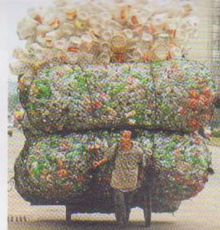
Raccolta rifiuti in plastica in Cina

... progettuale e produttiva. ... MINIMIZZARE = Ridurre la ... richiesta di energia, materiali ... e componenti. ... MATERIALI = Utilizzare ma- ... teriali facilmente separabili, ... riciclati e riciclabili, con cicli di ... vita continui. ... RIUTILIZZARE = Saper sfruttare ... ciò che già esiste per realizzare ... prodotti nuovi ed inediti. ... DURATA = Un prodotto sosteni- ... bile deve durare nel tempo ... e prevedere riparazioni e ag- ... giornamenti. ... FONTI ENERGETICHE = Privile- ... giare l'utilizzo di fonti energe- ... tiche rinnovabili. ... LOCALE = Sfruttare, laddove ... possibile e conveniente, le ... risorse locali. ... CONDIVISIONE = Scambiare le ... conoscenze mettendo a con- ... tatto professionalità di ambiti ... diversi anche esterni al mondo ... del prodotto. ... ESTETICA = Un prodotto sosteni- ... bile non deve rinunciare ... ai principi estetici. ... DIFFONDERE = Comunicare ... e rendere evidenti le qualità ... del prodotto per un'efficace