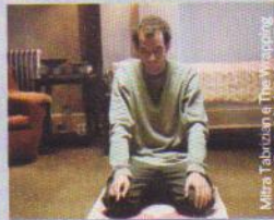
Mitra Tabrizian The Wayfinding Project Earth 2011, Livorno