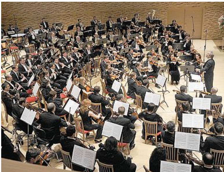
TRADIZIONE RUSSA L'orchestra del Teatro Marinsky questa sera sul palco della «Sagra Musicale Malatestiana»

Sul palco la celebre orchestra russa del Teatro Marinsky. Il 9 torna Zubin Mehta