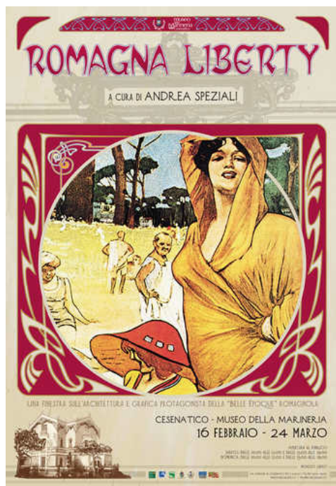
ROMAGNA LIBERTY. Una finestra sull'architettura e grafica protagonista della "Belle Époque" romagnola

inaugurazione sabato 16 febbraio, ore 11