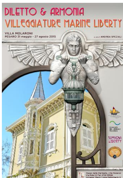
DILETTO e ARMONIA. Villeggiature marine Liberty

16.00-19.00. Lunedì chiuso. Info: tel.-fax.0721-35588; siti ufficiale: www.museomarineriapesarò.it | www.italialiberty.it/villeggiaturelibertymarine