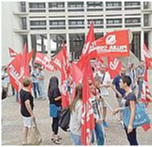
EX CORMO L'obiettivo è di salvare i posti di lavoro

Dureranno due giorni – domani e venerdì – i lavori di restyling alle Poste di Correggio per migliorare gli standard di qualità dell'ufficio di piazza Garibaldi. Resterà attivo l'Atm Postamat per prelievo contanti, interrogazioni su saldo e lista movimenti, ricariche telefonini e carte, pagamento utenze. Per altre operazioni occorre rivolgersi agli uffici di Carpi, Rio Saliceto o San Martino in Rio. L'ufficio postale di Correggio riaprirà al pubblico da sabato 29 agosto con i consueti orari.