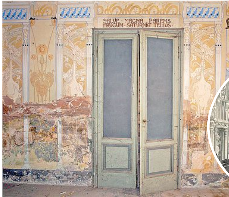
IN ROVINA A sinistra la villa correghese, sotto cartolina con l'interno del ristorante francese "La Fermette Marbeuf"