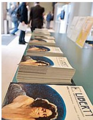
MUSEO Si conclude con una visita alla mostra