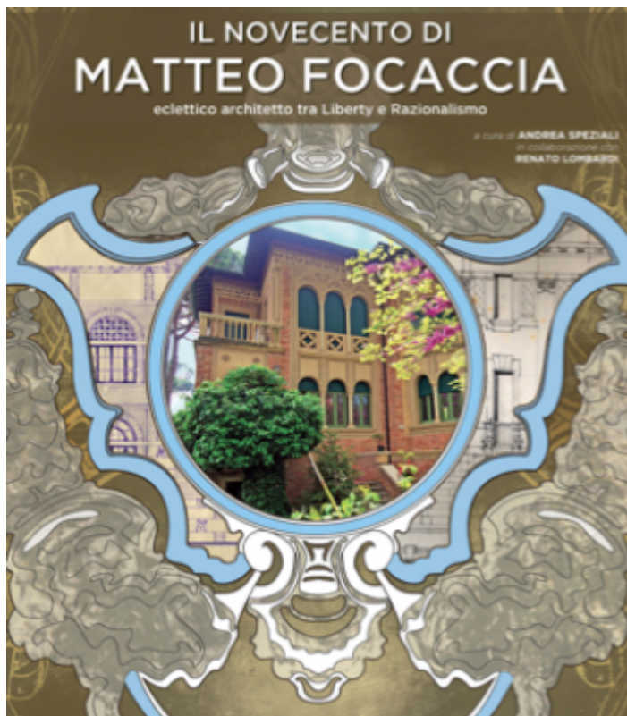
Villa Righini, Cervia. Design di Andrea Speziali