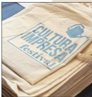
LIBRI Cultura impresa