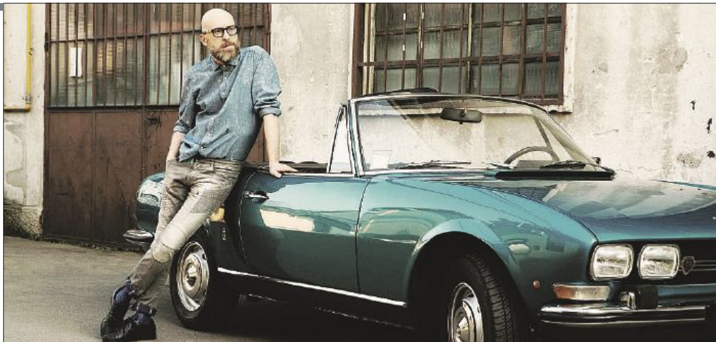
MARIO BIONDI Domani l'artista catanese torna al Carisport di Cesena – dove si esibì già nel 2010 – per il nuovo live di “Beyond”, disco appena uscito e da ieri al primo posto in classifica dei dischi più venduti

L'apertura verso i colleghi per lui è pari al piacere di condividere con i fan la musica che ama; fatto questo che spinge il