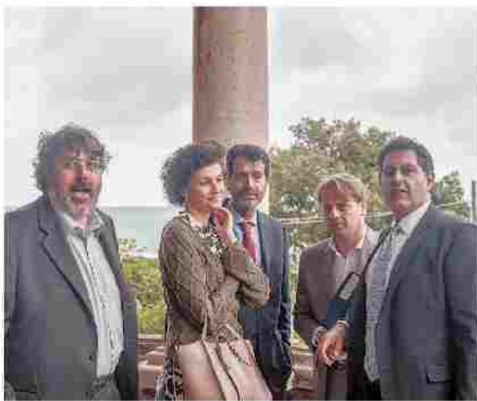
Da sinistra, Angelo Vaccarezza, Ilaria Caprioglio, Sandro Biasotti, Marco Scajola e il governatore Giovanni Toti ieri a Villa Zanelli per lanciare l'idea di recupero dell'immobile in abbandono dagli Anni '90

L'idea alla base del progetto è il recupero di Villa Zanelli uno dei gioielli storici ed esempio raro di liberty italiano, da anni chiuso e trascurato, che ha avuto vari proprietari e poi passata dalla Regione ad Arte nel 2012. L'idea del «Museo dell'estate» mira a creare un polo museale e di eventi che faccia rivivere la storia delle vacanze degli italiani nella società, con esposizione dei costumi dal primo novecento a oggi, manifesti turistici (protagonisti di una mostra organizzata dalla Regione nel 2002 con la giunta Biasotti) accessori, la filmografia dedicata alle vacanze in un percorso multimediale. Sono previsti uno stabilimento balneare, progettato come un parco a tema per far le varie epoche, ristoranti e bar che saranno luogo di eventi culturali, di intrattenimento di sfilate e mostre. Per realizzare questo polo museale la Regione prevede di usare risorse europee e fondi regionali per rientrare degli investimenti con le concessioni ai privati. «I finanziamenti verranno dai fondi Por-Fsc - ha spiegato Giovanni Toti - e il rientro degli investimenti arriverà dalle entrate per le concessioni degli spazi dove verranno organizzate le varie