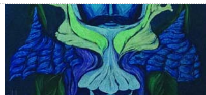
Fantasia da vedere

FONTE >> www.italialiberty.it/illibertyatavola