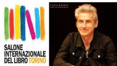
In diretta dal Salone Internazionale del Libro 2016: LIGABUE